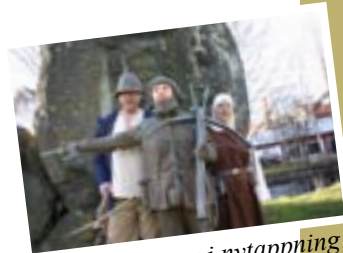
Dackespelet - nu i nytappning!

- Gotlands Kulturarvsportal kommer säkerligen att utgöra en tillgång för en nationell och internationell publik och locka många besökare med tanke på det intressanta kulturarv som ön har att presentera för internetpubliken.